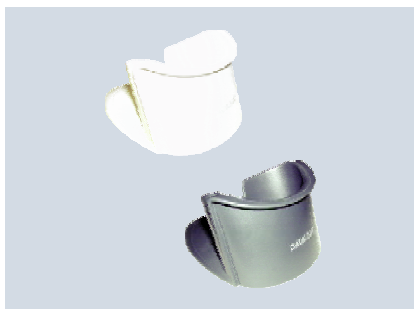
Support de table/mural Gryphon™