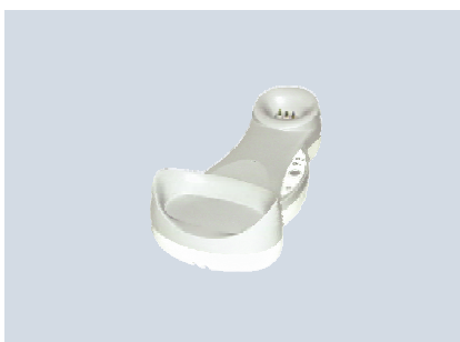
Base OM-Gryphon™ / C-Gryphon™