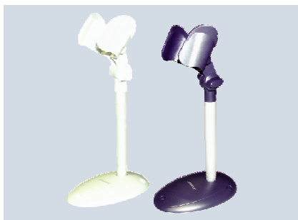
Support mains libres Gryphon™